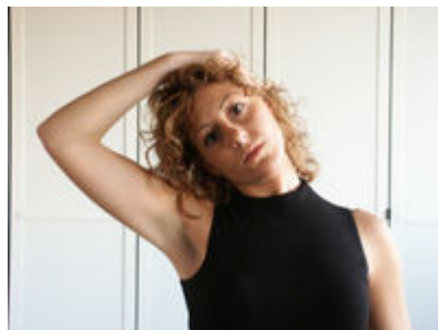
1 - Flettere il capo lateralmente a destra, mantenere la posizione per 30". Ripetere a sinistra

Per effettuare un buon allenamento è importante ripetere gli esercizi illustrati più volte, con una giusta pausa tra un esercizio e l'altro arrivando ad allungarsi sempre fino ad una soglia del dolore non eccessiva.